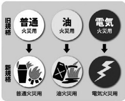
【消火器表示マーク】